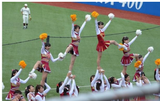
チアガールの応援