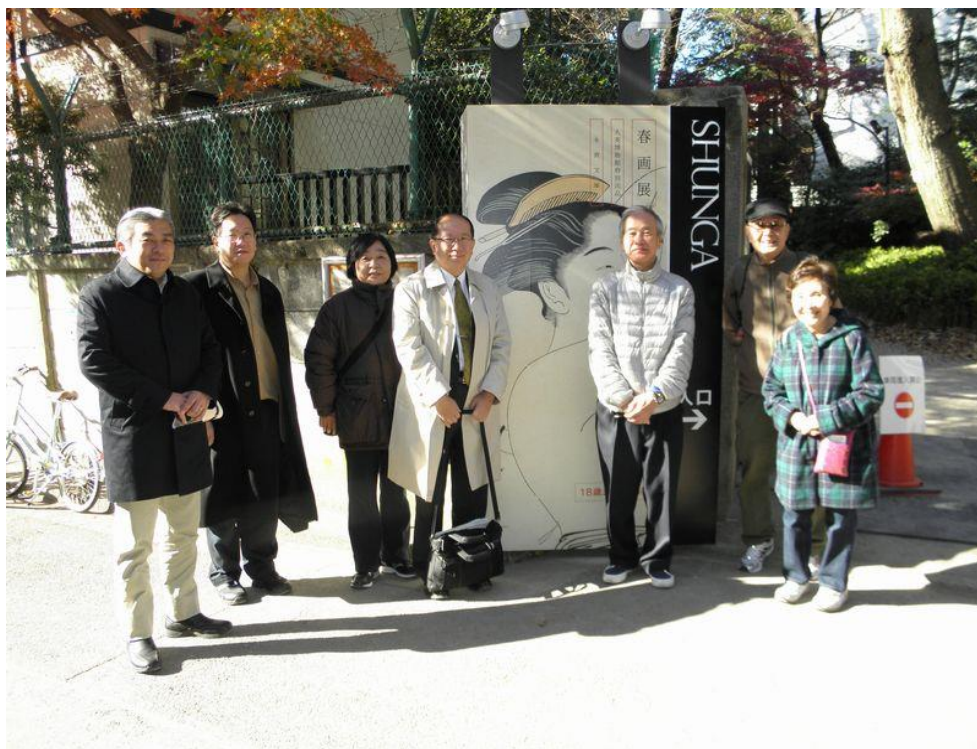
お散歩会集合写真