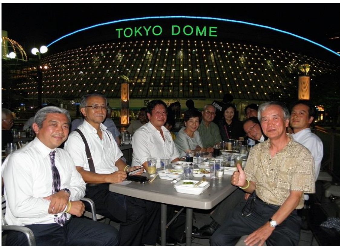
お散歩会・定期懇談会集合写真

東京ドームの「風と緑のビアガーデン」で美味しいビールと食事を楽しみました。集合時間の少し前まで雨が降り、テーブルと椅子が濡れていました。心配していましたが、乾杯時にはすっかり晴れ、気持ち良い風が吹いていました。終了後、若手主導の有志でカラオケの2次会。久しぶりの午前様になってしまいました。(清原保)