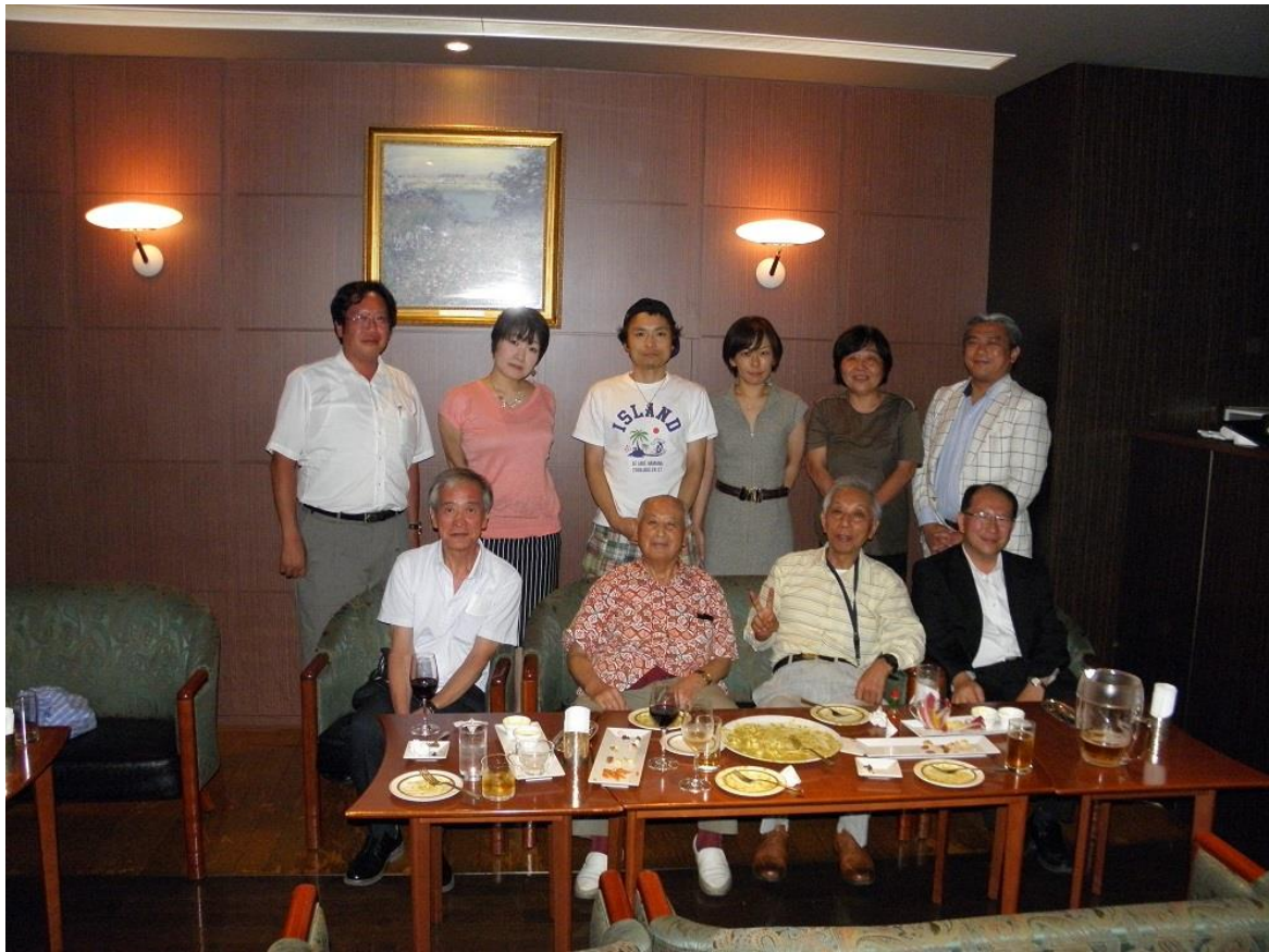
定期懇談会集合写真