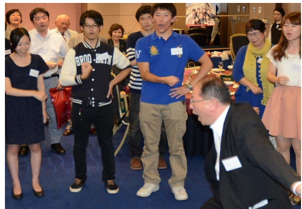
校歌を指揮する筆谷副会長