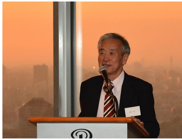
清原新会長 昭和44年(東大入試が無かった年)入学です。