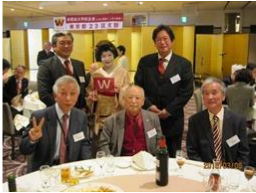
文京稲門会出席者と