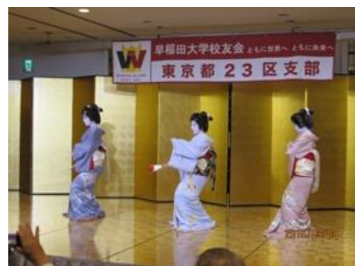
浅草芸者さんの踊り