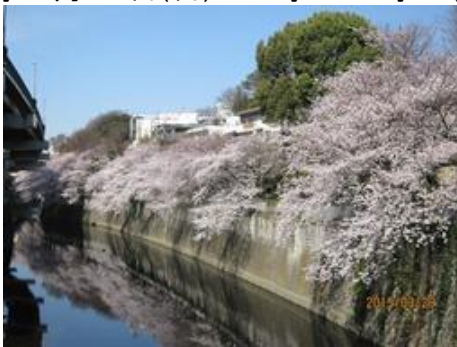
神田川に張り出した桜