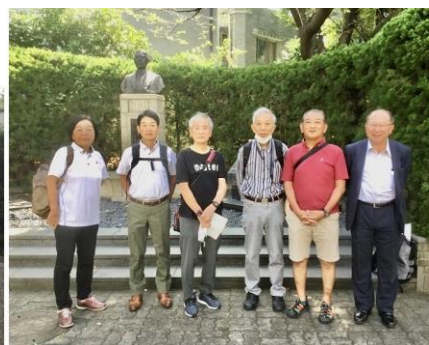
早稲田 旧安部球場跡