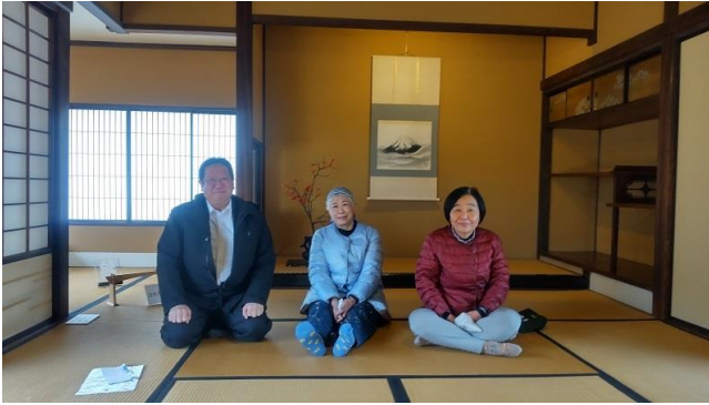
2階の畳の部屋でのんびり