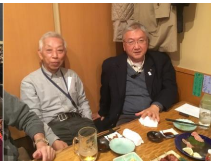
西早稲田での忘年会