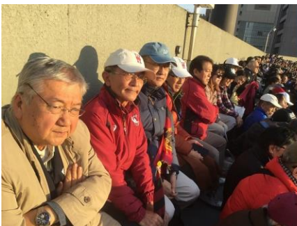
やっと買えた最後壁際での観戦