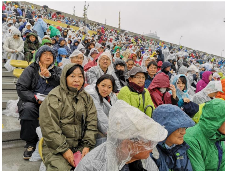
カッパでの応援風景