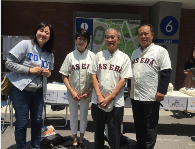
早稲田のユニフォームを着て