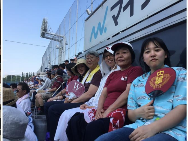
今回は風の吹き抜ける最上席で応援