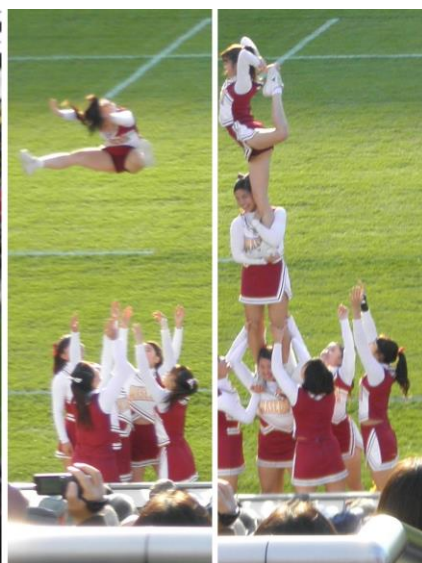
ハーフタイムのチア

(3) 11月26日(日) 18:00～ お散歩会(夜)肥後細川庭園 紅葉ライトアップを見学