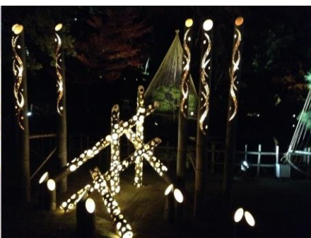
庭園のライトアップ