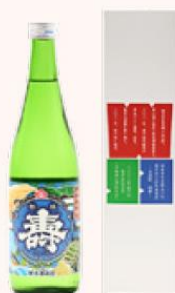
日本酒 磐城 壽 (大漁祝 紺碧)