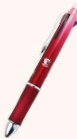
フリクションボール3 (メタル)